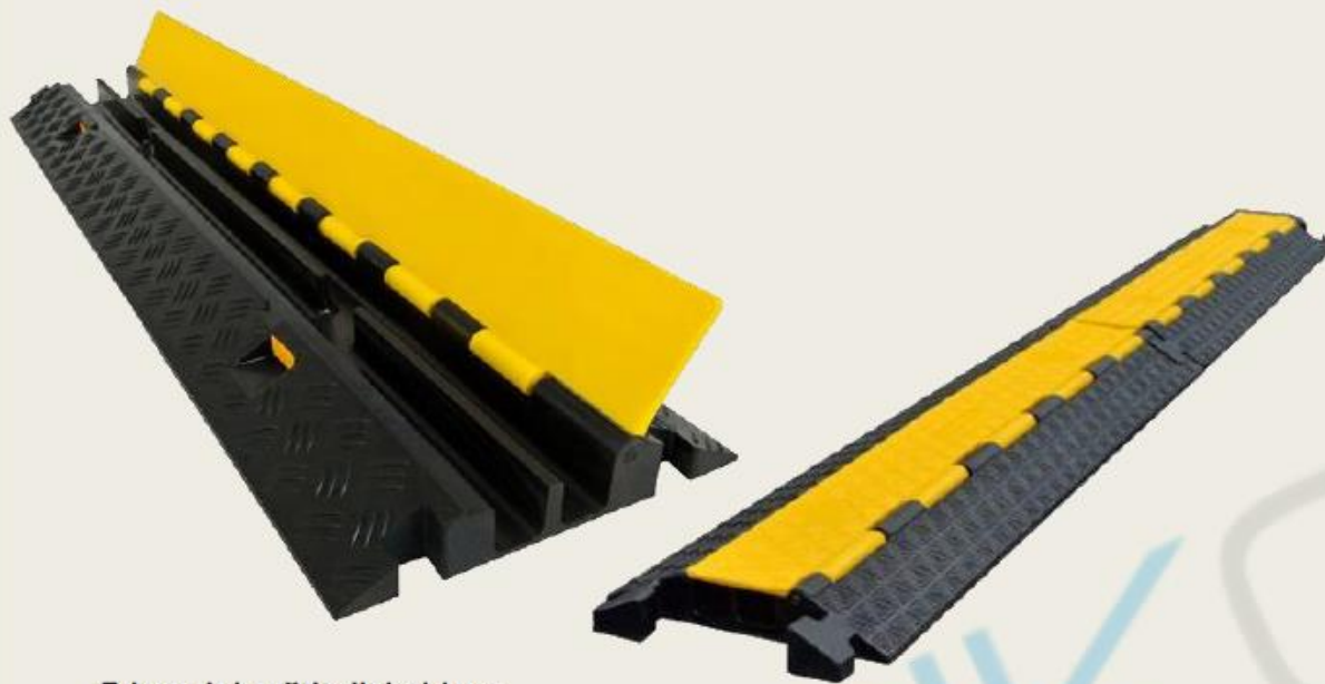
5-kanalni zaštitnik kablova