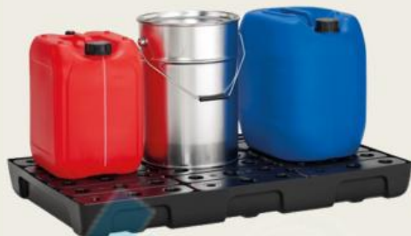
Posuda se PE rešetkom, 33lt