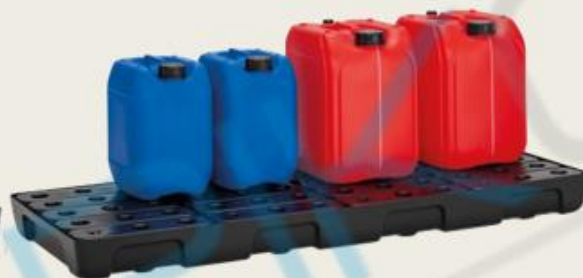
Posuda se PE rešetkom, 36lt