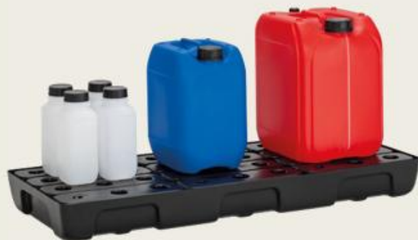
Posuda se PE rešetkom, 21lt