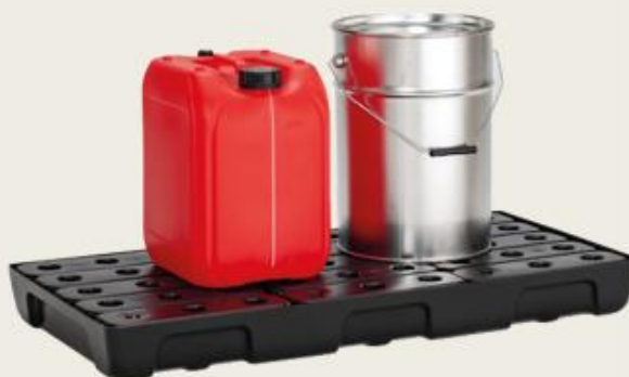
Posuda se PE rešetkom, 28lt