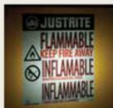
Vrlo vidljiva reflektujuća etiketa pruža upozorenje na engleskom, španskom i francuskom