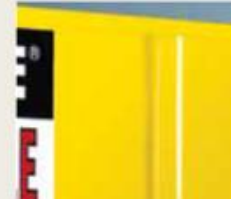
Zavarena konstrukcija omogućava duži životni vek