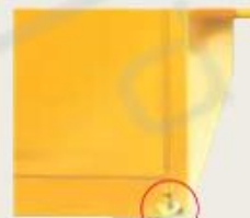
Podesivo nivelisanje ormara na neravnim površinama