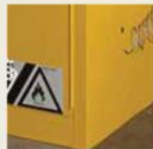
Ugrađen konektor za uzemljenje