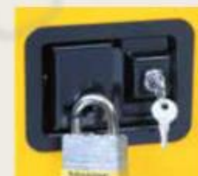
U-loc brava podrazumeva set od 2 ključa ili se može zaključati katancem (nije uključeno)