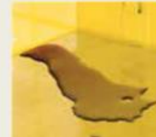
Sigurnosne police curenje odvođe nazad i direktno na nepropusno dno