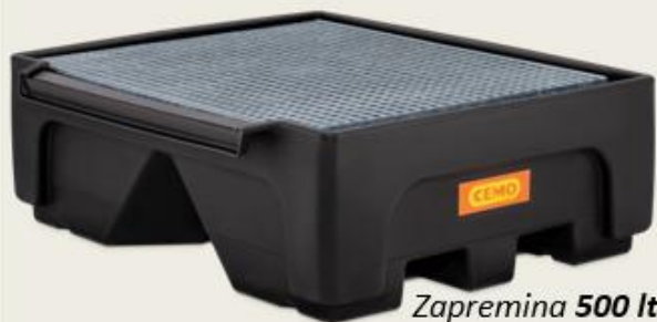
Zapremina 500 lt