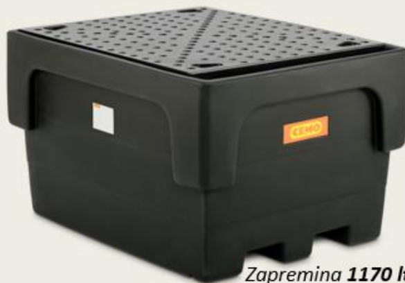
Zapremina 1170 lt