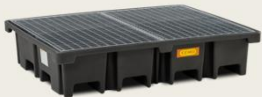
Tankvana od LLDPE materijala za 4 bureta Zapremina 460 lt